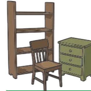
Büyük boyutlu atıklar

Evden alım hizmeti için: abholservice@stadtbildpflege-kl.de